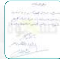
جمعية كسوة الكاسي