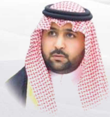
أمير منطقة جازان