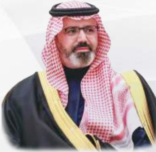
نائب امير منطقة جازان